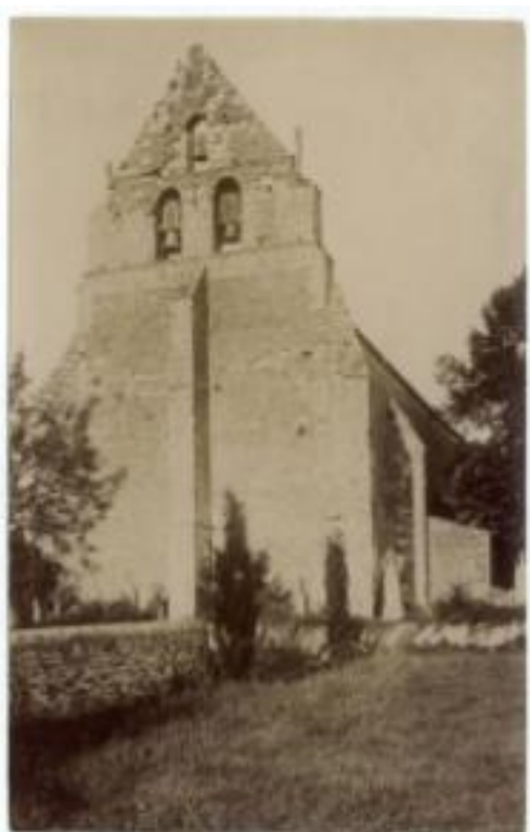
Le clocher de l'église

Les photos à reproduire sont les suivantes :