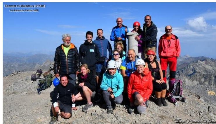
Sommet des Bailatous (3144 m) le 9 août 2020.