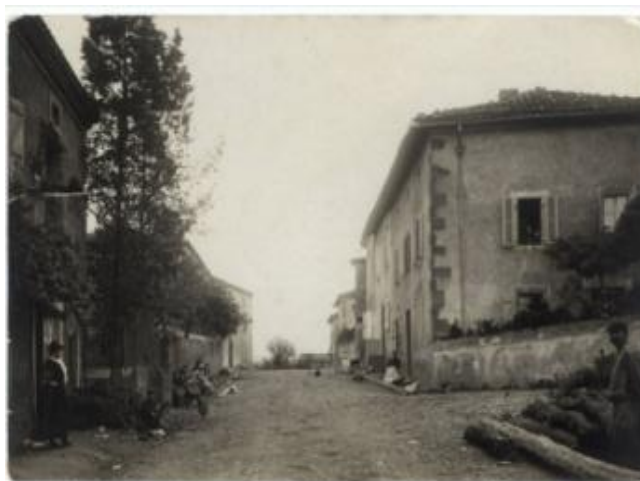
La Rue du Pradet