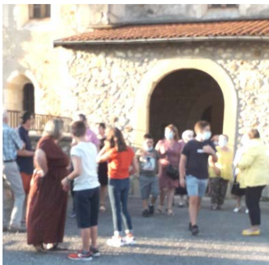
A la sortie de la messe

Voici quelques photos... en attendant des jours meilleurs et l'édition 2021.